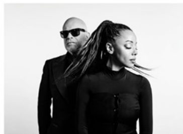
Live On Stage Truephonic