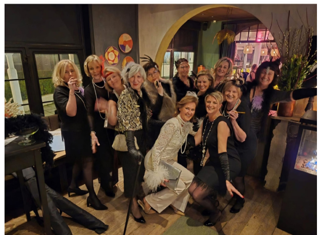
Fifty-One Club 't Zwin