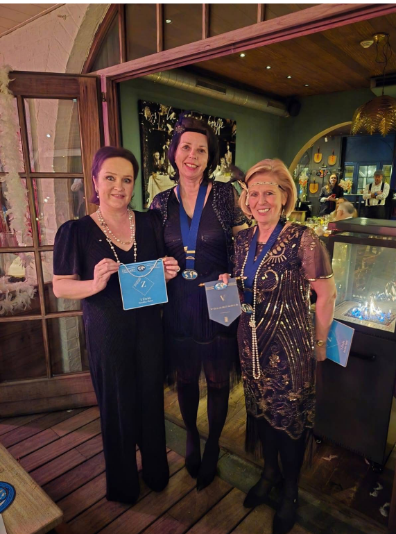
Fanion overhandiging van Fifty-One Club VOLUNTARIA