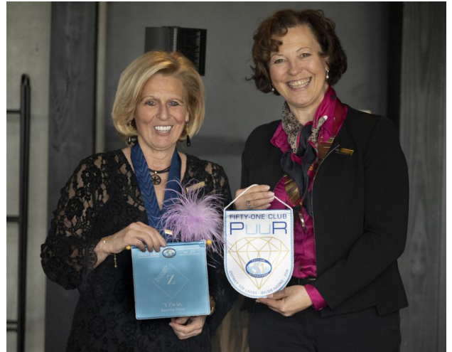
Fanion overhandiging van Fifty-One Club PuuR.